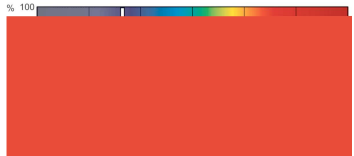
XDPB_XDMSR_SA-Spectral power distribution B/W