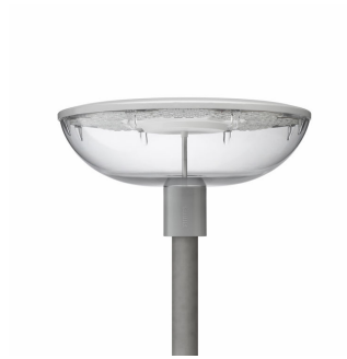
TOWNGUIDE PERF BOWL - LED GreenLine 2500 lm

Luminaire pour piétons TownGuide Performer BDP101 avec vasque dépolie