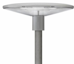
Luminaire pour piétons TownGuide Performer BDP100 avec vasque transparente