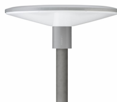
Luminaire pour piétons TownGuide Performer BDP100 avec vasque dépolie