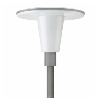
TOWNGUIDE PERF CLASSIC T - LED GreenLine 4000 lm

TOWNGUIDE PERF CLASSIC T - LED GreenLine 2500 lm