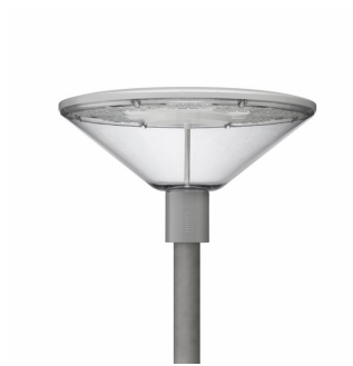
TOWNGUIDE PERF CLASSIC CONE - LED GreenLine 1200 lm