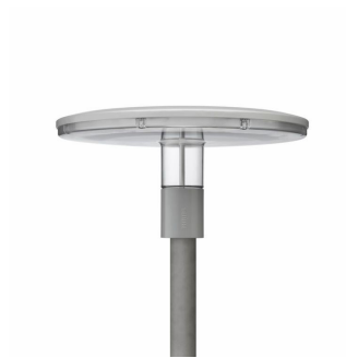
Luminaire pour piétons TownGuide Performer BDP104 avec vasque transparente

Luminaire pour piétons TownGuide Performer BDP104 avec vasque dépolie