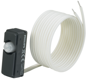
LRM8140/00 ActiLume G2 RF Mov Sensor