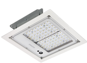
Mini 300 LED gen3