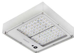
Mini 300 LED gen3