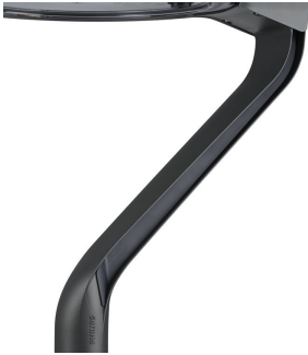
TownTune LYR BDP270